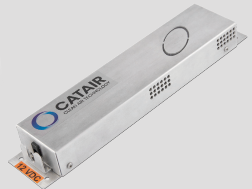
CATAIR ICE 125